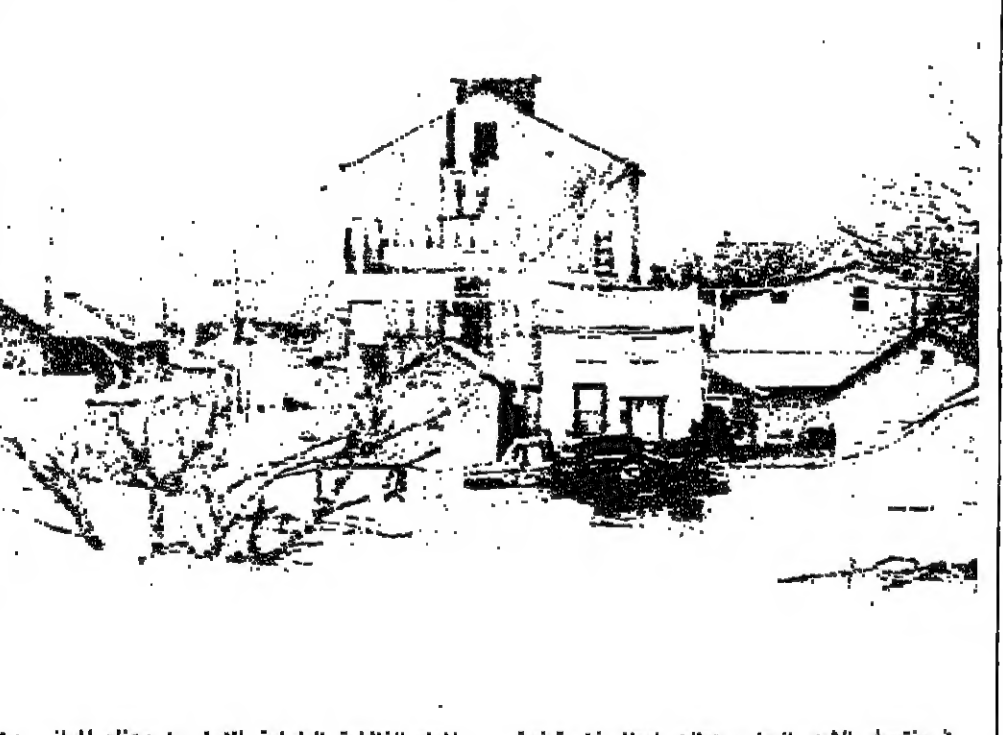
في منتصف الشهر الجاري، هطلت امطار غزيرة فوق ولاية كنتاكي الاميركية، الامر الذي تسبب بفيضانات كبيرة وبخسائر مالية جسيمة. في الصورة الاولى، المينينغ، المعدل بأحد عشر قدماً.